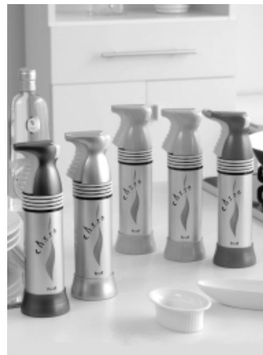
■ユニバーサルデザイン消火具「CASSO(キャッソ)」 型式：HUD 180、総質量：約305g 全高約235mm×全幅約72mm 放身時間(20℃)約16秒、放射距離(20℃)約2~3m 標準価格：3,800円 色：レッド、ガンメタリック、シルバー、ピンク、オレンジ(5色)

■商品のお問い合わせ・相談先 (株)初田製作所 〒573-1132 大阪府枚方市招提田近 3-5 フリーダイヤル：0120-82-2041 URL：http://www.hatsuta.co.jp/